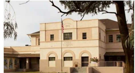
Davis Bilingual Magnet School 500 W St. Marys Rd, Tucson, AZ