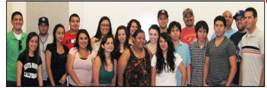
Estudiantes de Span 333 presentaron servicio en la escuela primaria C.E. Rose en 2012

Los estudiantes de Span 203, 253 y 333 tienen que cumplir con un componente de servicio voluntario durante el semestre. Se requiere que los alumnos de 203 y 253 presten 2 horas de servicio voluntario y los alumnos de 333, 5 horas. Primeramente, el alumno selecciona un lugar en la comunidad de preferencia, una organización o agencia que trabaje con hispanohablantes y que tenga la misión de mejorar nuestra comunidad. Por último, el estudiante prepara una reflexión o un proyecto sobre su experiencia. Las instrucciones completas están en las notas de clase.