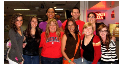
Instructores de LH, primavera de 2013