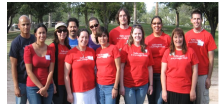
Instructores de LH, otoño de 2010